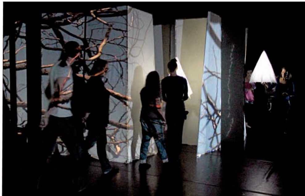
Publikum er selv med til at bygge en labyrint under forestillingen.

Life Live! spiller i Svend Heinild Centret to gange om dagen frem til søndag. Forestillingen rykker herefter til Viborg, Helsingør, Aalborg og slutter i København i december. ■